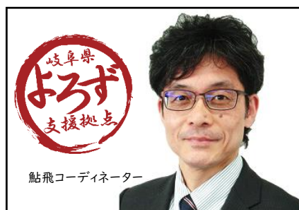
鮎飛コーディネーター