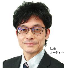
鮎飛 コーディネーター

販促カレンダーを活用すると、なんとなく作っていた「売上計画」が具体化し、目標設定がしやすくなります。会社における「1年間の流れ」を把握する事から始めてみましょう。